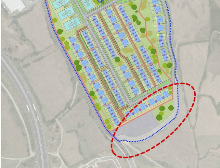
Reserva de viario para conexión viaria con A-8

LUNES, 18 DE DICIEMBRE DE 2023 - BOC NÚM. 240