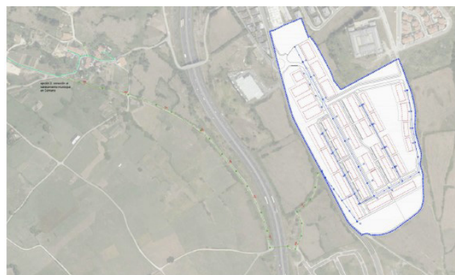
Solución de vertido de aguas residuales hacia Sámano

En lo relativo a la red de aguas residuales, tras analizar varias alternativas con la empresa municipal de aguas, ésta recomienda plantear la conexión a la red existente de un modo semejante a la solución planteada para la red de aguas pluviales, cruzando bajo la autovía A-8 y siguiendo un camino vecinal en dirección norte hasta llegar a Sámano, en donde se conectaría con el saneamiento municipal. Esta tubería de vertido funcionaría por gravedad y es consecuente con lo establecido en el artículo 51.6 de la Normativa de la revisión del Plan Hidrológico de la Demarcación Hidrográfica del Cantábrico Occidental, aprobada por Real Decreto 1/2016, de 8 de enero. Se muestra imagen indicativa del trazado propuesto: